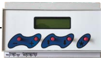
COFFRET CAN FIL PILOTE